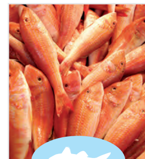
Salmonete de roca